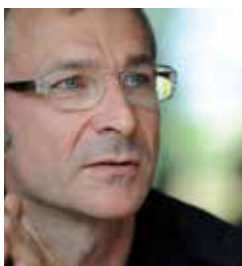
Deutscher Bundestag, Fraktion BÜNDNIS 90/DIE GRÜNEN Volker Beck, MdB