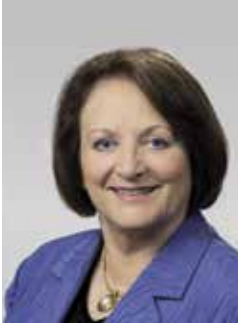
Vorsitzende des Kuratoriums Bundesjustizministerin Sabine Leutheusser-Schnarrenberger, MdB

Die Bundesstiftung Magnus Hirschfeld, die in den Bereichen Bildung, Wissenschaft und Forschung einer gesellschaftlichen Diskriminierung von Mitbürgerinnen und Mitbürgern entgegenwirken soll, ist nun gerade einmal eineinhalb Jahre alt. Sie hat in dieser Zeit trotz begrenzter finanzieller Mittel ein beachtliches Arbeitspensum absolviert und bereits eine große gesellschaftliche Aufmerksamkeit und lobende Anerkennung ihrer Arbeit erfahren. Wie viel die Stiftung im ersten Jahr der Errichtung bereits geleistet und bewirkt hat, belegt schon der bloße Umfang des vorliegenden ersten Tätigkeitsberichts für das Geschäftsjahr 2012. Besonders hervorheben möchte ich den würdigen Stiftungsfestakt am 24. Mai 2012 im Centrum Judaicum, die erfolgreiche Ausrichtung der vielbeachteten ersten HIRSCHFELD -TAGE in Berlin, den Start der Vortragsreihe HIRSCHFELD-LECTURES und den Beginn der Förderung erster Projekte.