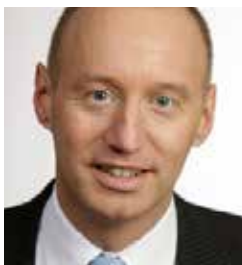
Deutscher Bundestag, Fraktion der FDP Michael Kauch, MdB