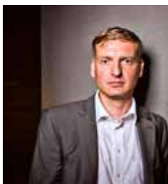
Uwe Neumärker Stiftung Denkmal für die ermordeten Juden Europas