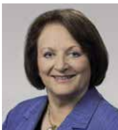
Vorsitzende Bundesministerium der Justiz (BMJ) Bundesjustizministerin Sabine Leutheusser-Schnarrenberger, MdB