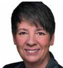
Deutscher Bundestag, Fraktion der SPD Dr. Barbara Hendricks, MdB