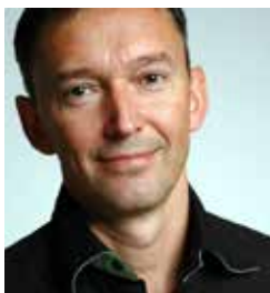
Dr. Klaus Müller kmlink Consultancy