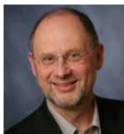
Dr. Rainer Marbach Stiftung Akademie Waldschlösschen