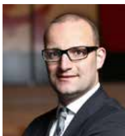
Deutscher Bundestag, Fraktion der CDU/CSU Jens Spahn, MdB